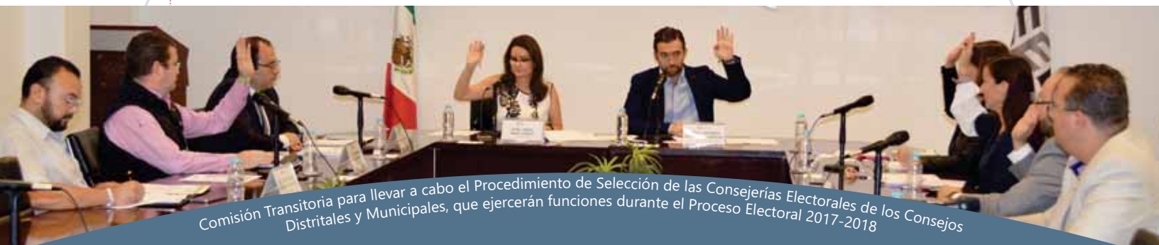
Comisión Transitoria para llevar a cabo el Procedimiento de Selección de las Consejerías Electorales de los Consejos Distritales y Municipales, que ejercerán funciones durante el Proceso Electoral 2017-2018

La Dirección Ejecutiva de Educación Cívica y Participación Ciudadana y la Presidencia de la Comisión, rindieron sus informes de actividades.