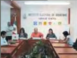
Sesionaron comisiones permanentes del Consejo General para elegir presidentes, vocales y secretarios