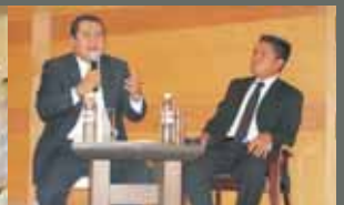
Comisión Técnica contemplada en el Convenio de Coordinación IEQ-IFE y Jornada de Capacitación en Materia de Fiscalización impartida por Alfredo Cristallinas Kaulitz, titular de la Unidad de Fiscalización de los Recursos de los Partidos Políticos del IFE