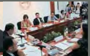
Presentación de los dictámenes de los estados financieros de partidos políticos y asociación política en sesión ordinaria de Consejo General