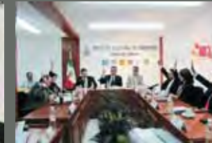
El Consejo General aprobó el financiamiento público para partidos políticos