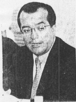
LUIS CARLOS Ugalde, presidente del Consejo General del IFE.

Sostuvo que al sólido andamiaje de la limpieza del proceso electoral ha sido necesario agregarle otros peldaños para garantizar la transparencia y la equidad en las condiciones de la contienda como el nuevo reglamento de fiscalización, los informes detallados de las pre-campañas, la tregua del año 2005, el Acuerdo de Neutralidad para Servidores Públicos y el monitoreo de publicidad en medios de comunicación, entre otros.