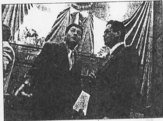
Ayer sesionaron los diputados en la Legislatura.

En entrevista la diputada priista expresó que esta situación va atrasar la realización de este acuerdo, ya que las campañas inician el próximo 5 de