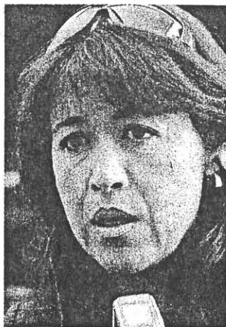
ADRIANA Fuentes Cortés, diputada.

La también presidente de la Comisión de Desarrollo Urbano, Obras Públicas y Comunicaciones del Poder Legislativo dijo que la consolidación del crecimiento metropolitano puede darse a lo largo de los siguientes 20 o 25 años.