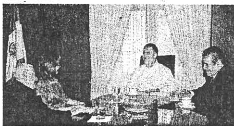
EL GOBERNADOR Francisco Garrido comprometió respeto a la ley y un proceso electoral con equidad y transparencia.

El Pleno de la LV Legislatura del Estado entregará la presea a quien sea designado merecedor, en memoria del natalicio del evangelizador franciscano Junípero Serra, hace más de 500 años.