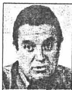
GERMÁN BORJA GARCÍA Alcalde de Corregidora

"Estamos teniendo un crecimiento explosivo por eso estamos cuidando mucho nuestros usos de suelo, en este momento tenemos 71 mil lotes esperando para que se construyan fraccionamientos con usos de suelo que se otorgaron en la otra administración y tenemos casi 32 mil