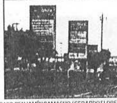
Están distribuidos en la ciudad. Promueven las obras públicas de Gobierno.