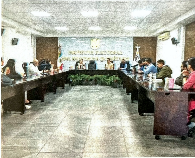
Ley. El IEEQ determinará la viabilidad de la asociación política.

En sesión de Consejo General se determinó que, el informe del tercer trimestre cumplió con lo