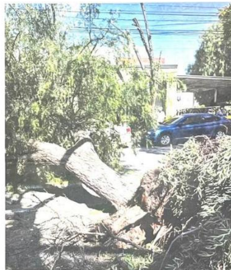
CAMIONES PESADOS turban árboles en la Colonia Álamos. Este martes tiraron otro.

Serenidad y paciencia. -BALA DE SALVA- Pendiente.