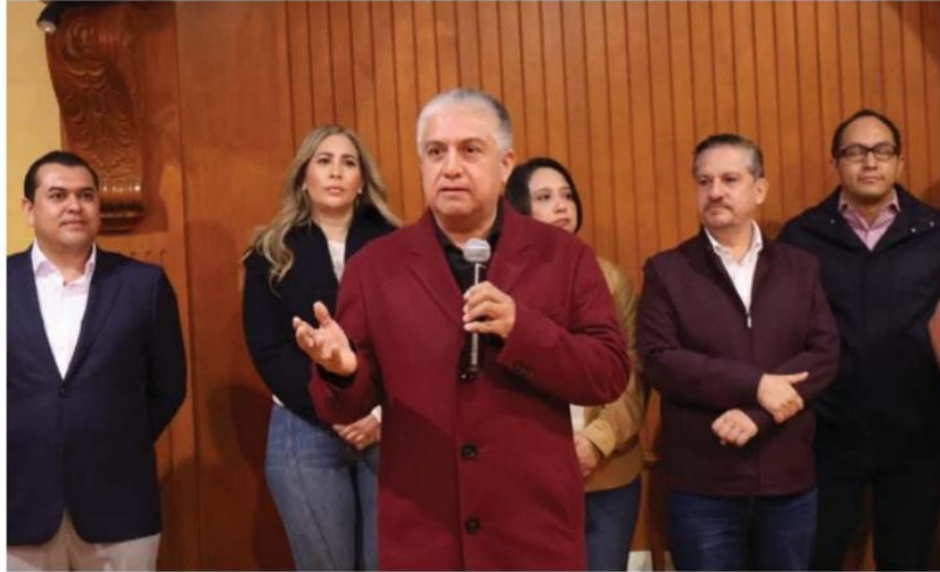
Legislación. Debe estar publicada tres meses antes del inicio del proceso electoral.