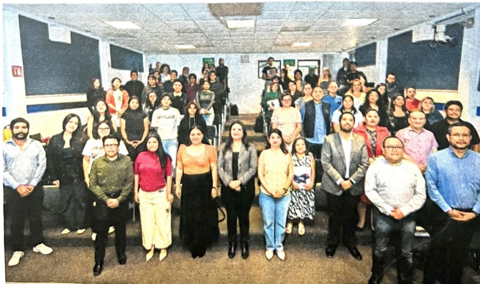
Se presentó la plataforma que ofrece “una visión de la evolución política y electoral de Querétaro”.

Puntualizó que en la reciente actualización se agregaron temas de género. Además de grupos de atención prioritaria: diversidad sexual, afrodescendientes, migrantes, personas indígenas, personas con discapacidad, jóvenes y adultos mayores. Y por primera vez se hizo un repositorio de las boletas electorales del año 1996 al 2024. ●