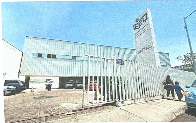
Otros procedimientos que lleva el IEEQ son por uso indebido de recursos públicos, actos anticipados de campaña y propaganda que vulnera el interés superior de la niñez.

La consejera Olvera Moreno detalla que los procedimientos son sobre todo por violencia política contra mujeres en razón de género