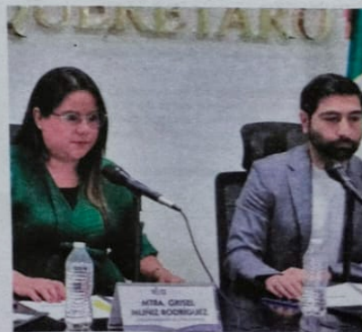
Dijo que los actores políticos pueden impugnar la resolución.

Por ello, garantizó que el IEEQ dará cumplimiento y certeza a las determinaciones tomadas por los órganos jurisdiccionales, como se ha hecho en las últimas semanas.