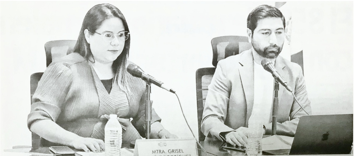
REALIZA IEEQ nueva reasignación de diputaciones plurinominales.