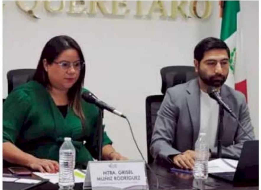
Modificación. El IEEQ modificó la lista por el revés de la Sala Regional al TEEQ.