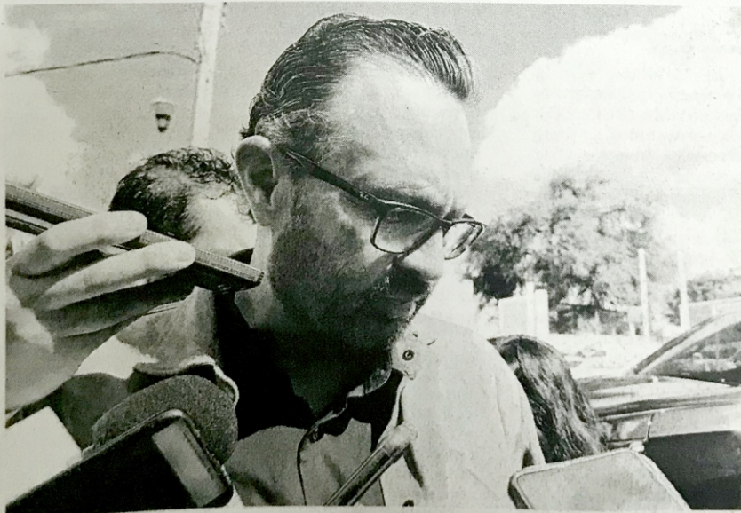
Mauricio Kuri, gobernador de Querétaro.

"Por una parte, da movilidad de personas que puedan llegar, pero también por otra parte le quita la posibilidad a una persona que ha hecho un buen trabajo de poder seguir. Yo creo que es un tema 100 por ciento de la legislatura, del cual yo seré muy respetuoso", comentó.