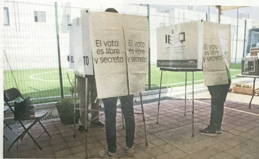
El mandatario queretano cuestionó que la oposición señale al Instituto Electoral de Querétaro cuando se tiene una elección en contra y no cuando los resultados son favorables.

El gobernador cuestiona que se señale a la institución, luego de que Morena pidiera la nulidad de la elección en San Juan del Río