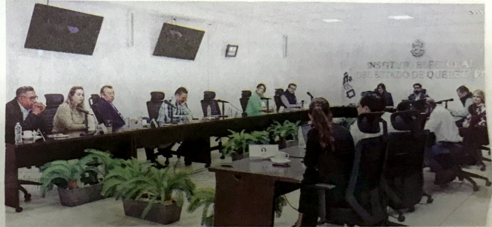
SERÁ EL Tribunal Electoral el que determine la sanción a la que serán acreedores estos partidos en la entidad.

fueron los únicos dos partidos que no cumplieron con este requisito, en donde el 99% de los candidatos sí subieron su información que permitió a los ciudadanos emitir un voto mucho más informado.