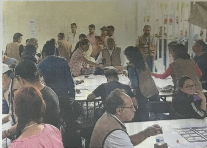
IEEQ informó que se declaró la validez de las elecciones en 14 distritos locales y 4 ayuntamientos, entregando las constancias de mayoría a excepción de San Juan.

El IEEQ informó que, hasta el jueves por la tarde, luego de que concluyeron los cómputos oficiales y los recuentos administrativos en su caso, se declaró la validez de elecciones en 14 distritos locales y 4 ayuntamientos,