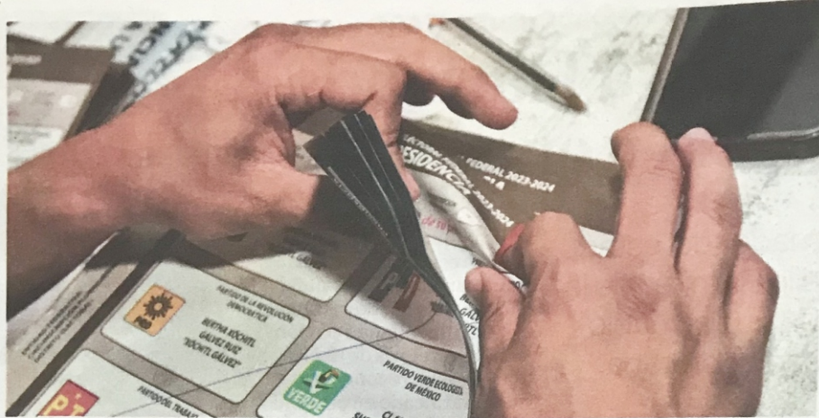
El pasado 2 de junio, la ciudadanía eligió a sus nuevos gobernantes.

Hasta el cierre de esta edición, los consejos distritales y municipales del IEEQ entregaron constancias de mayoría a 14 ganadores de diputaciones locales