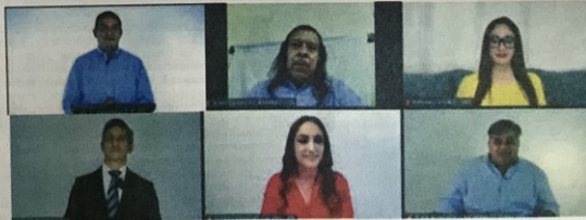
CANDIDATOS de diversos partidos políticos expusieron sus propuestas para el municipio de San Juan del Río.

El candidato morenista afirmó que la violencia e inseguridad en el municipio se deben a la falta de voluntad política para resolverlos, "porque es un gobierno que tiene, para menos, el incumplimiento con los policías, por eso la sociedad está como está. Roberto señalaba el acto vandálico en sus carros de policía."