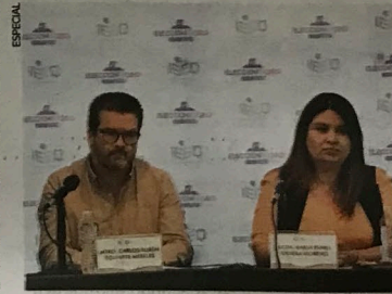
La votación anticipada se realizará en mayo, informaron las autoridades electorales locales.

Detalló que entre la documentación y el material que se entregará al INE se encuentran el sobre voto para votación anticipada local, plantillas Braille para las elecciones de diputaciones y ayuntamientos, hojas de incidentes, constancias de clausura, actas de escrutinio y cómputo, el cartel de resultados