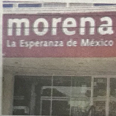
Delegación. Manifestó que el proceso está cerrado.

Dicho documento, señala que el reparto de regidurías