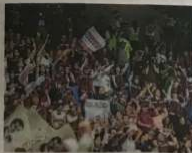
Morena y el PT irán en candidaturas comunes en 12 municipios y en 13 distritos locales.

Respecto a diputados locales, 12 participarán; sólo 9 buscarán la reelección, mientras que tres más van por diputación federal y una busca la presidencia de Jalpan de Serra.