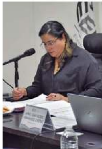
IEEQ. Aprobó registros.

Instituto Electoral del Estado de Querétaro (IEEQ) aprobó las solicitudes de registro que presentaron los precandidatos vía presencial y en línea entre el 3 y el 7 de abril.