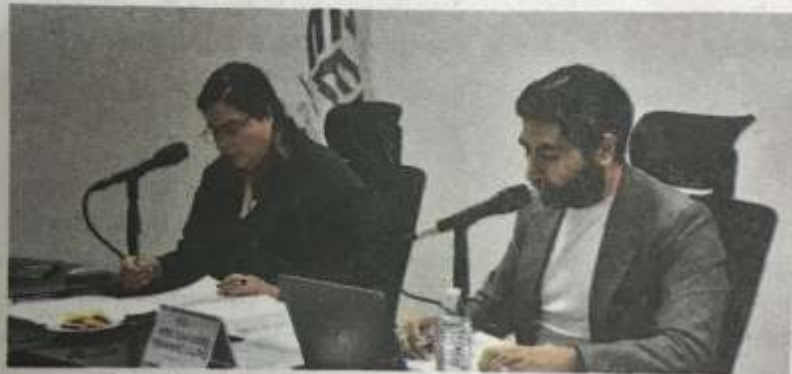
La sesión se desahogó después de las 20:00 horas.