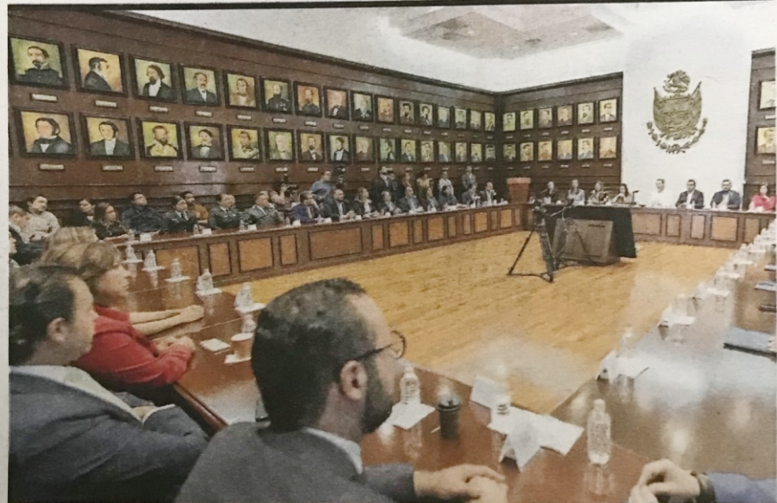
Realizan transmisión conectada con otros estados.

En el país existen 314 centros de detención, con una población total de 222 mil 133 personas privadas de la libertad.