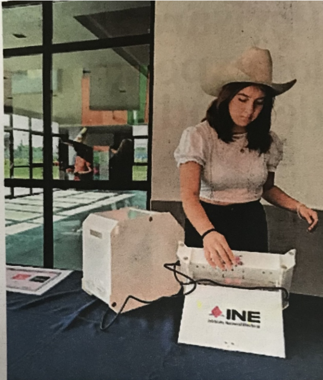
El IEEQ llevó a cabo el ejercicio. ESPECIAL

Además, detalló que 12 actas fueron capturadas a través de modelos que reconocen los datos asentados en las actas mediante inteligencia