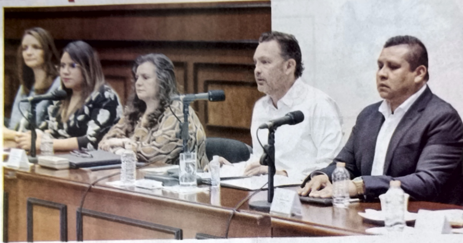
REALIZAN tercera sesión de la Comisión Especializada para Ejercer el Voto en los Centros Penitenciarios de Querétaro.

"Estamos hablando de una enorme población que hasta hace poco, no era visible para ejercer el derecho humano del sufragio y de su participación activa en la democracia del país. Por eso reconozco el esfuerzo que está realizando la comisión especializada integrada por operadores del Sistema