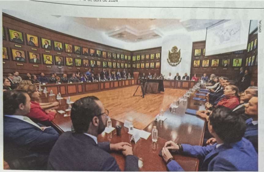
Se recalcó que la colaboración institucional resulta indispensable para garantizar el derecho al voto.