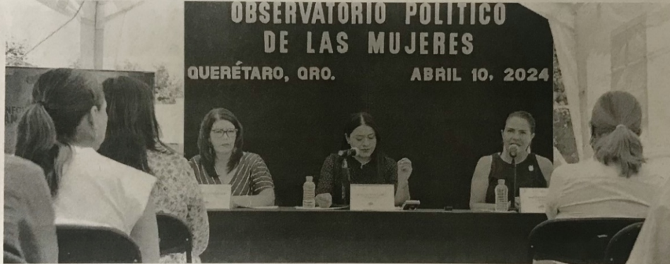
ACUERDAN la realización de tareas en materia de prevención de violencia política en contra de las mujeres.

La conformación de este organismo tiene como finalidad la inclusión de las mujeres en la vida política estatal, en donde se comentó que la sociedad ha tomado plena conciencia de que la incorporación de las mujeres en la toma de decisiones es el corazón