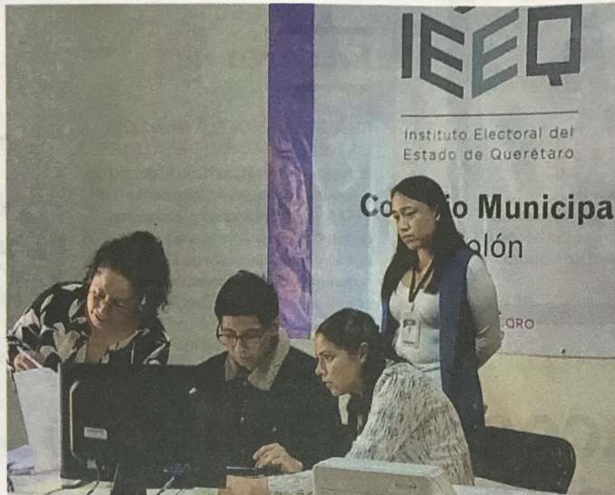
El IEEQ validará cada uno de los registros para validar las candidaturas.

LA PROCEDENCIA DE LAS SOLICITUDES DE DIPUTACIONES LOCALES Y AYUNTAMIENTOS SE RESOLVERÁ ANTES DEL 14 DE ABRIL