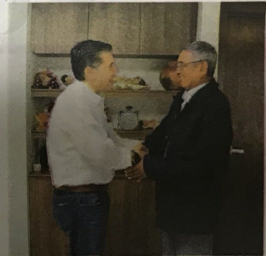
Obispo de Querétaro dio la bendición al precandidato, previo al inicio de campaña.

Habló sobre la importancia de la formación en la familia, la importancia de ser un buen ejemplo y cumplir la palabra ante los hijos.