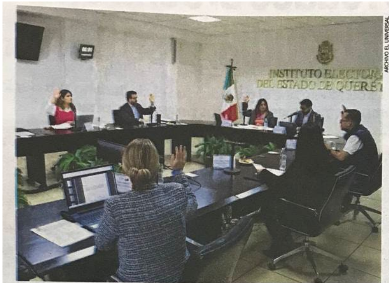
La información de las candidaturas podrá ser consultada en la plataforma Candidatas y candidatos, conóceles, a partir del 15 de abril en la página ieeq.mx , el micrositio eleccionesqro.mx .