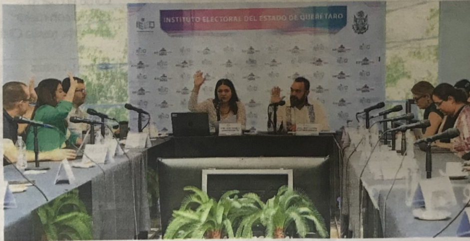
Las Comisiones Unidas ordenaron remitir el dictamen con el protocolo y sus anexos a la Secretaría Ejecutiva.

La consejera explicó que el protocolo estipula cómo se canalizará a las víctimas cuando se requiera una atención especializada y/o se esté ante la presencia de hechos que pudieran ser competencia de otra autoridad, así como la identificación de factores de riesgo para solicitar a las autoridades com-