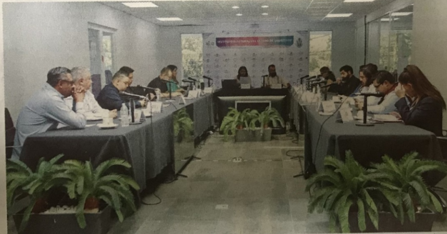
EL PROTOCOLO se enmarca en el convenio de colaboración y coordinación del IEEQ con autoridades estatales y municipales.

Asimismo, explicó que el Protocolo estipula cómo se canalizará a las víctimas cuando se requiera una atención especializada y/o se esté ante la presencia de hechos que pudieran ser competencia de otra autoridad, así como la identificación de factores de riesgo para solicitar a las autoridades competentes que dicten el otorgamiento de medidas de protección que consideren