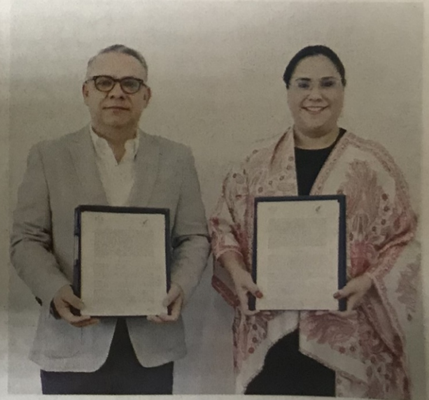
ESTE convenio permitirá implementar diversos mecanismos que garanticen una vida libre de violencia a las candidatas.

A través del instrumento signado se establecen las bases de colaboración para la integración e intercambio de información sobre aspirantes a cualquier cargo de elección popular, que se encuentran registradas con alguna condena por sentencia firme por violencia política contra las mujeres en razón de género, conforme a la normatividad aplicable.