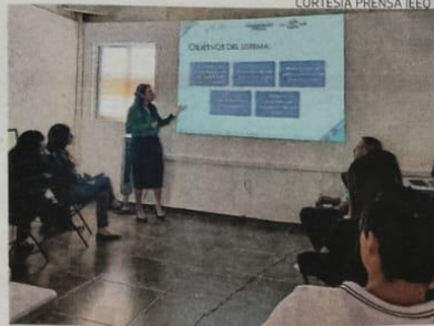
Sistema "Candidatas y Candidatos, conóceles".