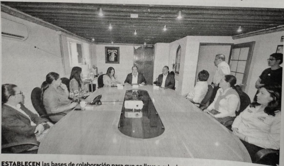
ESTABLECEN las bases de colaboración para que se lleve a cabo la promoción del voto en el Proceso Electoral Local 2023-2024.

Por lo que, en el mes de mayo, al reverso de los recibos de la JAPAM se encontrará información de esta índole otorgada por el IEEQ.