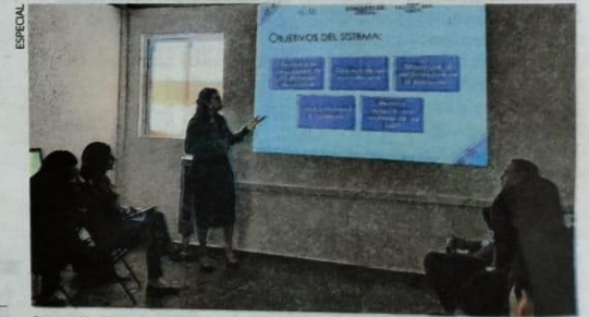
Se realizó una capacitación dirigida a integrantes de partidos políticos y aspirantes independientes sobre el uso del sistema.