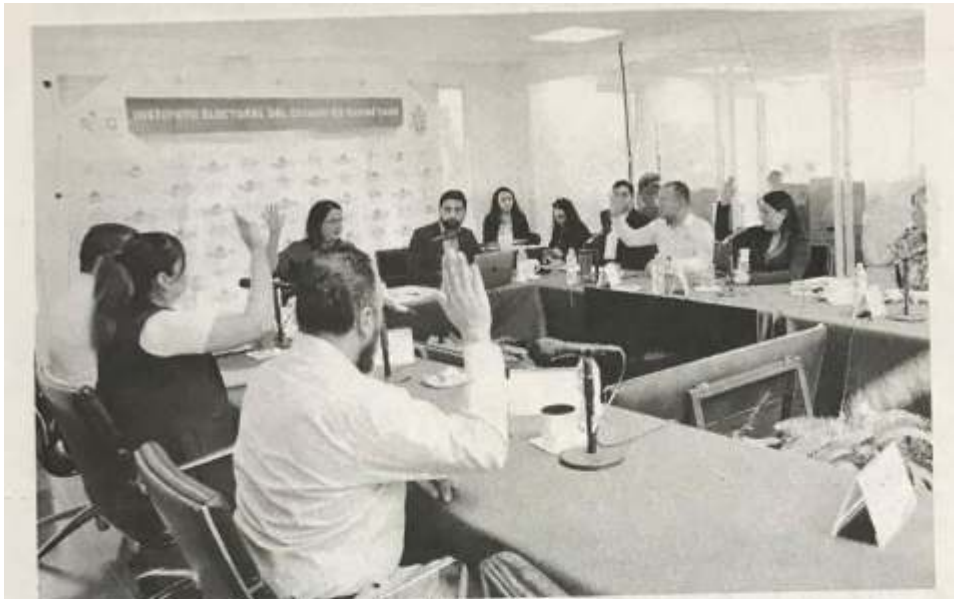
CON 7 votos a favor, el Consejo General aprobó el proyecto