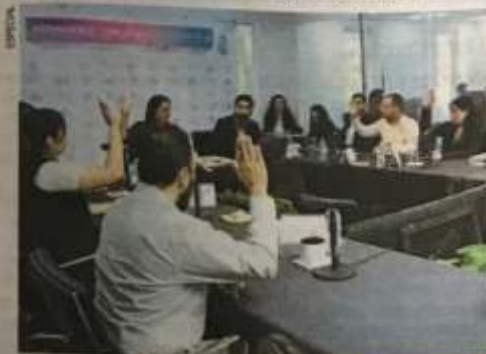
Este acuerdo implica la respuesta inmediata tras la notificación de los candidatos, previo a la entrega de una solicitud formal.

"Ya se capacitó a todos los secretarios técnicos y a quienes están en los distritos para que, si les cae una solicitud, la remitan a Secretaría Efectiva y en ese momento estaría vinculándose con las autoridades. El mensaje es que, en el momento en que se reciba, se canalice y nosotros tenemos ya los enlaces para tener una respuesta efectiva", señaló. ●