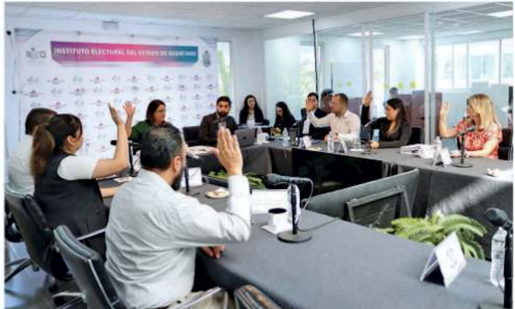
Alianza. Los partidos determinarán a sus propios candidatos para competir en las elecciones.