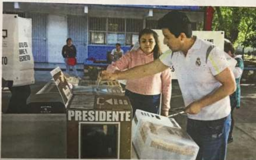
La red de organizaciones Querétaro Participa manifiesta que es necesario contar con una ley que sea accesible, y que permita a los ciudadanos incidir de manera real y práctica en la toma de decisiones políticas del estado.

Colectivos afirman que debe pasar antes de la elección, para que la iniciativa no sea congelada por el nuevo Congreso local