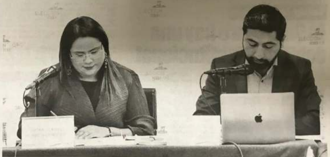
SERÁN votados 33 cargos a nivel local.

"Estaremos en línea a través de la Dirección de Tecnologías que, de manera permanente, también estamos en contacto con todas las fuerzas políticas y el soporte está de manera permanente. Se tuvo una capacitación