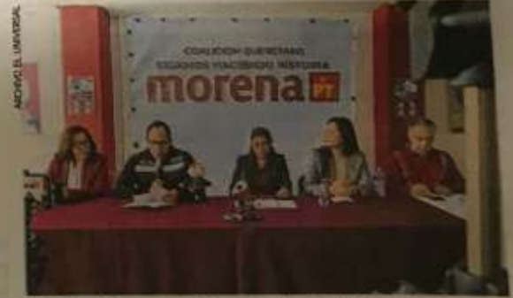
A finales del mes pasado las mesas de negociación entre ambas formaciones optaron por no ir en coalición.

en coalición: 12 abanderados para alcaldes y 13 para diputados.