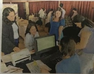
Los capacitadores recibirán, clasificarán y almacenarán los materiales electorales.

Por su parte, las personas supervisoras coordinarán a que-