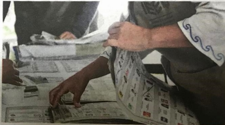
El periodo de registro concluye el 6 de abril.

las personas contratadas como capacitadoras apoyarán en la recepción, clasificación y almacenamiento de la documentación y materiales electorales; serán responsables del conteo, sellado y agrupamiento de las boletas electorales, y otras actividades.