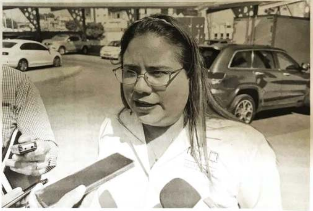
ACTOS anticipados de campaña y uso indebido de recursos entre las principales quejas.

Añadió que nueve de las quejas se han canalizado ante el Tribunal Electoral del Estado de Querétaro (TEEQ). Sin embargo, con el cuidado del debido proceso, será hasta que se de la resolución de las mismas que podrá ahondarse en la información al respecto sobre los partidos y actores políticos involucrados, así como las sanciones a las que podrían ser sujetos.