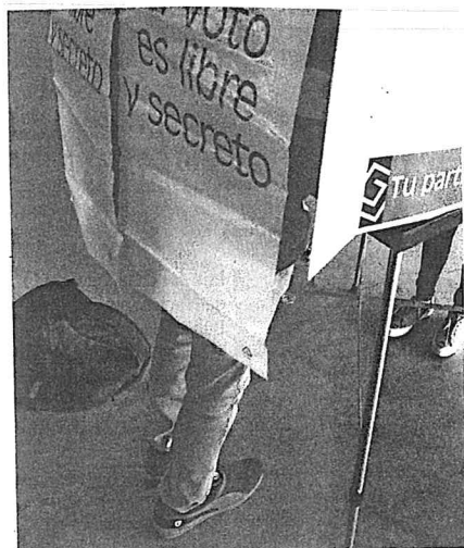
El ejercicio democrático fue dirigido a una población estudiantil de más de 900 personas.

Durante el presente año, el IEEQ ha utilizado este sistema informático en la elección de la Mesa Directiva del 15 Parlamento Infantil de la Legislatura del Estado y en cuatro instituciones de educación superior en la entidad.