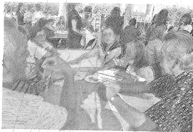
EL EJERCICIO se lleva a cabo con el Instituto Electoral del Estado de Querétaro y el INFOQRO.