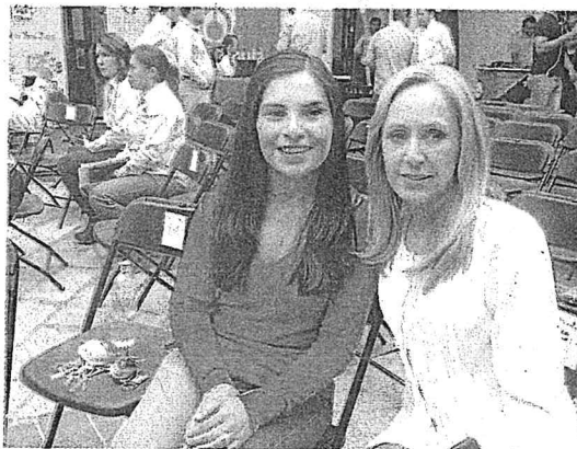
DIF de El Marqués detendrá tres de sus programas.

Por último informaron que las actividades de apoyo se retomarían inmediatamente después de concluido el periodo comicial.