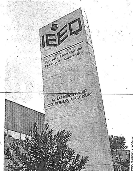
En diciembre de 2017 terminó el periodo de la última contralora.