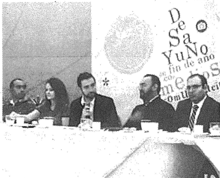
DESAYUNO de fin de año con medios de comunicación.

miento de los medios de comunicación para con el IEEQ, a fin de que la sociedad pueda informarse de las resoluciones de la vida democrática de Querétaro.