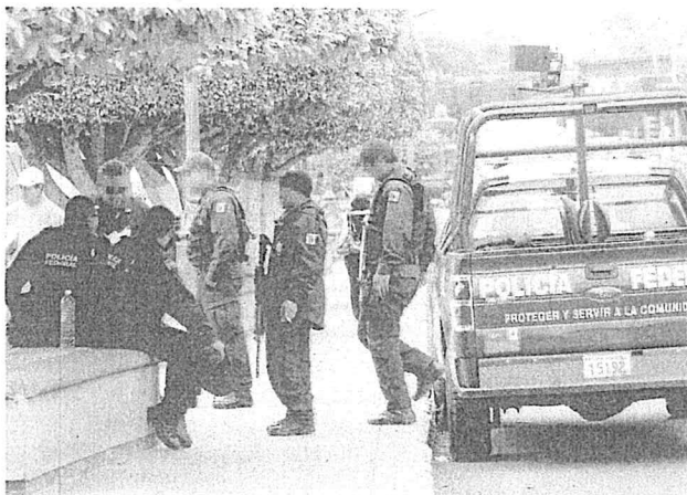
ARCHIVO. EL UNIVERSAL

“Los ciudadanos de Huimilpan tienen derecho a volver a votar, a hacer su sufragio el día 6 de diciembre próximo. Todo el ambiente en el municipio de Huimilpan y todas sus comunidades es un ambiente de tranquilidad, de paz. Ya todos los partidos políticos se están preparando para esta contienda electoral que arranca oficialmente el próximo fin de semana”, detalló. ●