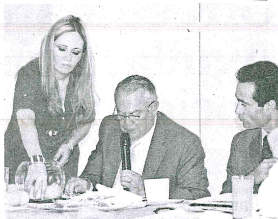
Los temas que se podrían abordar serían sobre economía, social y anticorrupción; se realizarán en la sede de la Fecapeq.

Para el debate entre aspirantes a la presidencia municipal, el primero en intervenir será