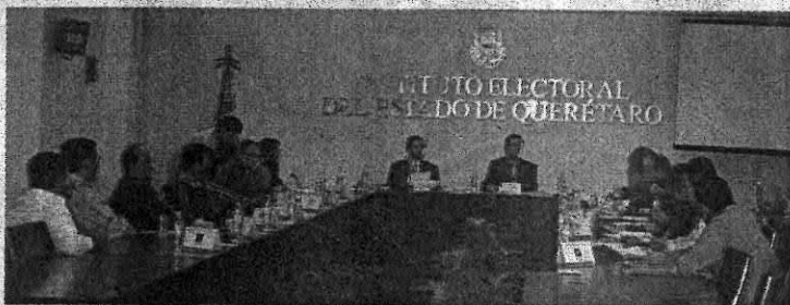
El Instituto Electoral local determinó que los estatutos presentados por dicha organización no se encontraban apegados a derecho.

Pese a que con 22 mil 665 ciudadanos distribuidos en 10 municipios de la entidad, Convergencia Ciudadana logró cumplir con el número de afilia-