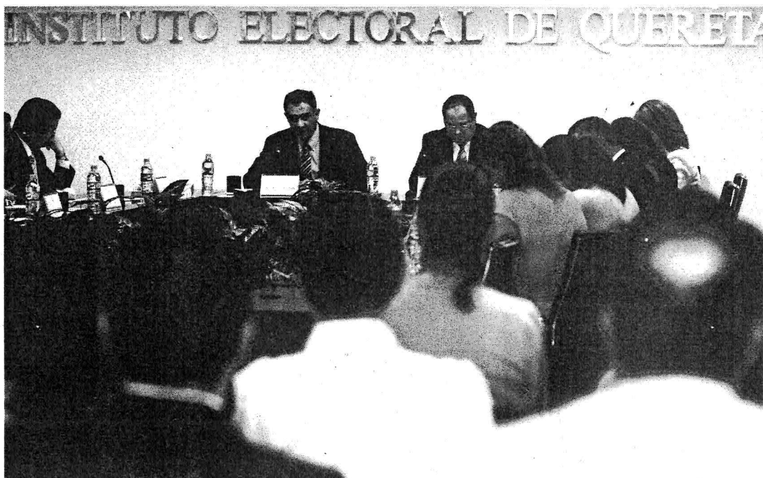
Los institutos locales serán modificados en su forma de operación cuando la reforma política entre en operación.