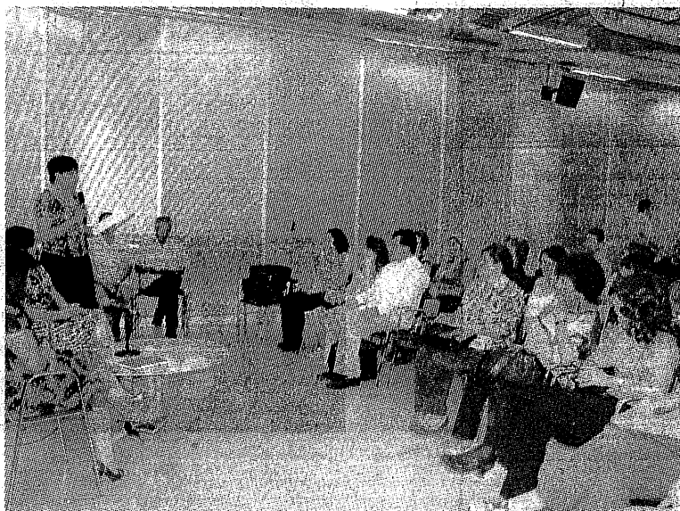
CELEBRARON EL Primer Foro "La participación de la Mujer en la Política", organizado por el Movimiento Ciudadano por Querétaro AC.

"Aún cuando la Ley Electoral del Estado de Querétaro garan-