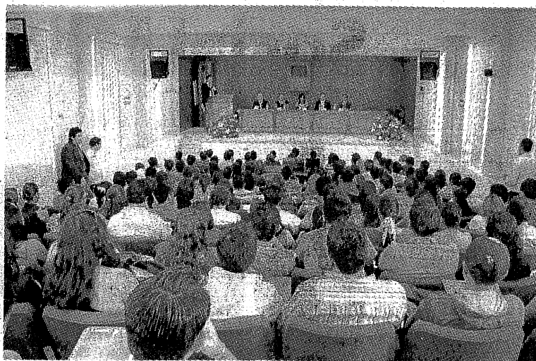
EN EL CAMPUS San Juan del Río, de la UAQ, comenzó el ciclo de conferencias sobre el Derecho Electoral, promovido por el IEQ.