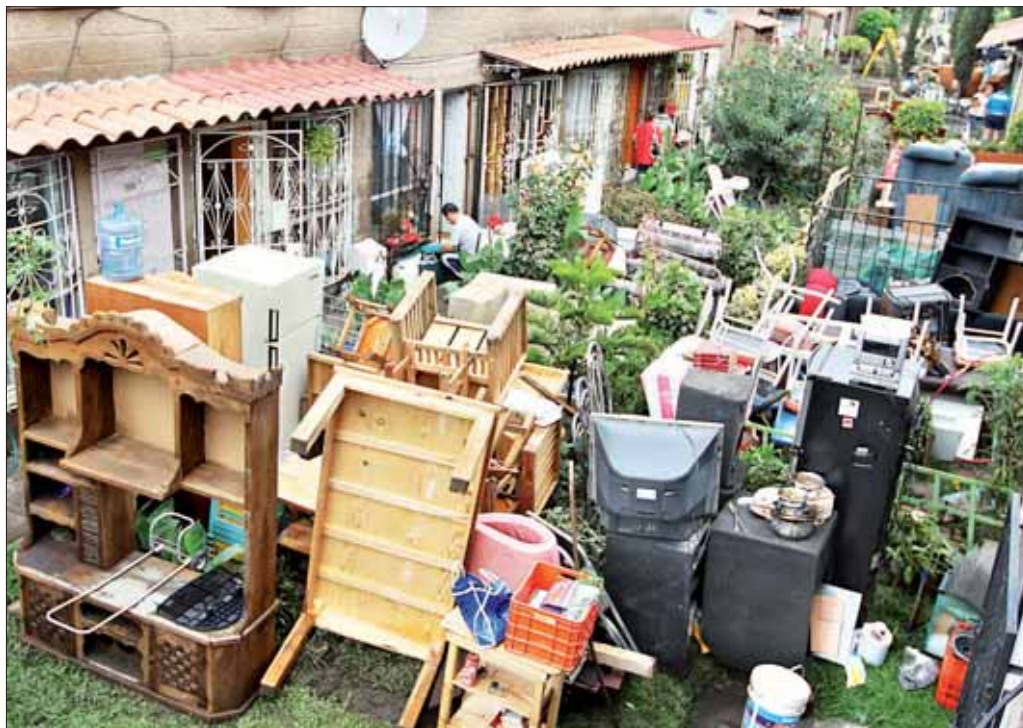
Las lluvias provocadas por la tormenta tropical Arlene , además de daños materiales —en la imagen, Iztapalapa—, dejaron ayer un saldo de 10 personas muertas en el país. Los municipios de Ecatepec y Nezahualcóyotl fueron declarados zona de desastre natural