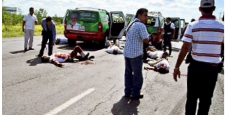
► Algunos de los acompañantes de Torre Cantú quedaron malheridos tras el atentado en el que el candidato fue asesinado.

La Procuraduría del Estado anunció anoche que localizaron tres vehículos presuntamente relacionados con la emboscada sin dar detalles de las unidades.