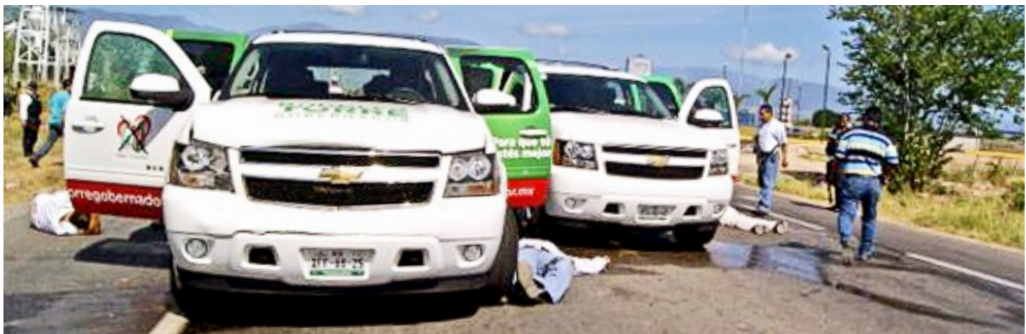
ESCENA DEL CRIMEN. Nuevas imágenes revelan la forma en la que quedaron los vehículos y las víctimas de la emboscada.

disfrazados, así como los de la camioneta pantalla, comenzaron a disparar directamente sobre Torre Cantú y su comitiva.