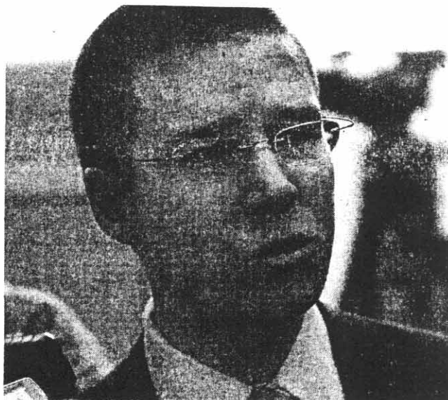
EL DIRIGENTE del PAN Ricardo Anaya dijo que no se solapará a nadie, por las investigaciones en Oficialía Mayor.

“En tales procedimientos no es dable, por tanto, presuponer ningún hecho, pues serán las autoridades competentes las que determinen, habiendo oído a las partes, lo que en su caso proceda. El PAN reitera su compromiso con la legalidad y se mantiene atento a los procedimientos iniciados ante autoridades competentes”.