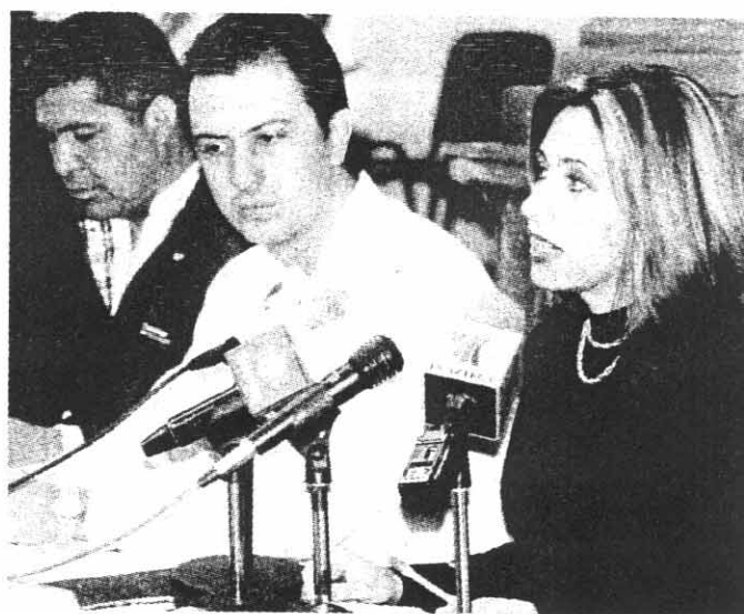
ADOLFO ORTEGA Osorio, presidente de la Comisión Estatal de Derechos Humanos, acompañado por visitadores de la institución, presentó los resultados del 'Diagnóstico General de las Condiciones de los Centros de Prevención y Ejecución de Sanciones Penales'

Por su parte, la Visitadora General de la CEDHQ, Mónica