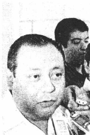
BRAULIO GUERRA Urbiola, presidente del PRI.

De ninguna manera especuló de los nombres los ex servidores públicos que se manejan, cree que en los expedientes están encontrando senderos de quien tomó determinadas decisiones, es decir, quien ejerció los recursos, de que manera o quien instruyó