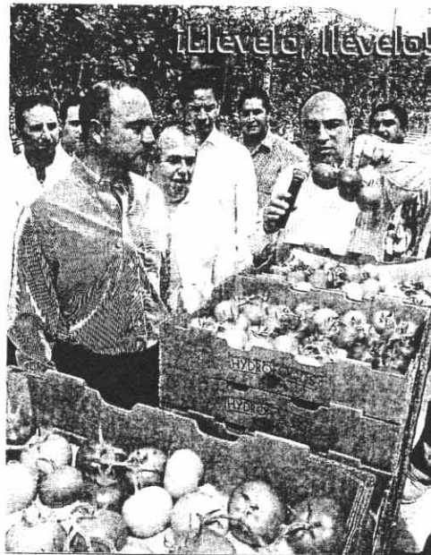
El gobernador José Calzada visitó las instalaciones del "Agropark", ubicado en el municipio de Colón, con la finalidad de conocer el funcionamiento del mismo