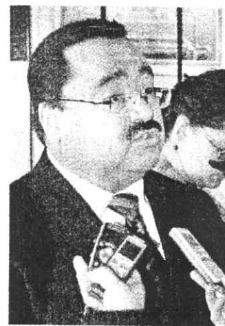
DIPUTADO HIRAM Rubio García, presidente del Congreso del Estado.

De ahí viene una propuesta que le hará a la Mesa Directiva del Congreso del Estado para que la siguiente sesión plenaria sea la primera que se celebre fuera de la sede legislativa y ocurra en el