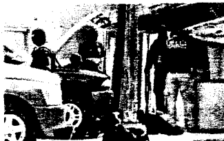
PERITOS FORENSES trabajan en torno a la zona donde cuatro personas fueron acuchilladas ayer en una populosa colonia de Ciudad Juárez.

En Ciudad Juárez han sido desplegados unos seis mil militares y más de dos mil policías