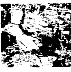
En Messina, Italia ocurrió ayer otro corrimiento de tierra que obligó a la evacuación de lugareños.