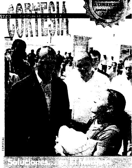
► El gobernador del estado, José Calzada, entregó 90 viviendas a igual número de familias en esta demarcación; en este escenario, el mandatario destacó la importancia de que los queretanos cuenten con un techo propio