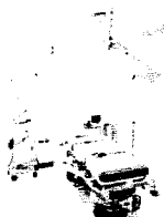
MODERNOS QUIRÓFANOS para la atención hospitalaria.