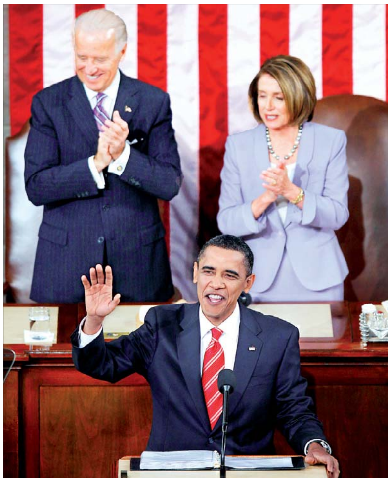
IMAGEN Y BALANCE DEL PRIMER AÑO

Barack Obama presentó ante el Congreso estadounidense el llamado Estado de la nación . Su discurso lo enfocó en el terreno económico y social. Argumentó que las primeras acciones de su gobierno se centraron en estabilizar el sector financiero y expuso: "no fueron populares, pero se evitó una segunda Gran Depresión y ahora hay señales de que lo peor ha pasado". Admitió que millones todavía padecen las consecuencias de la crisis, pero prometió un segundo paquete de estímulos para generar empleos