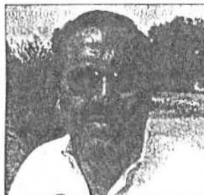
Leobardo Vázquez Briones, alcalde de Colón.