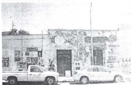
ALGUNAS casonas antiguas representan riesgos para la población, dada su mal estado.

Por último, se dio a conocer en esta denuncia ante instancias judiciales, se agregará que la catorna para la renovación del Comité Directivo Municipal está plagada de inconsistencias jurídicas, lo que contraviene los estatutos del PRI.