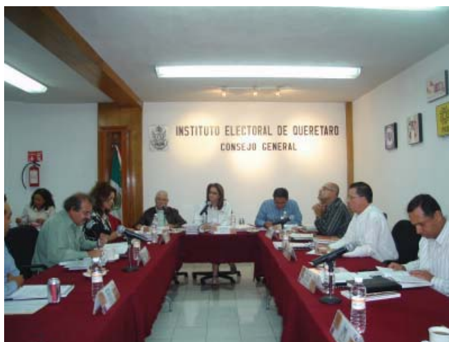
Consejo General del Instituto Electoral de Querétaro.