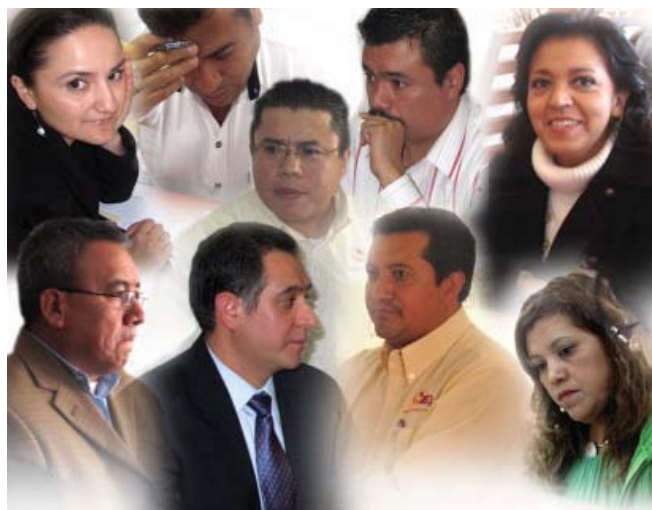
Estructura operativa de la Dirección General del IEO.