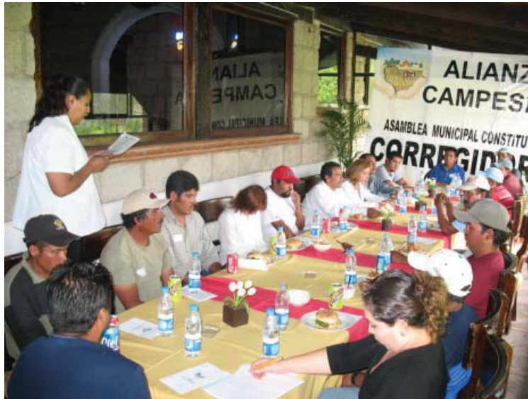
Asamblea de Alianza Campesina para obtener su reconocimiento como organización política estatal.