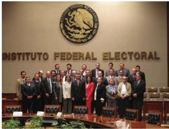
Coordinación entre Organismos Electorales y el IFE.