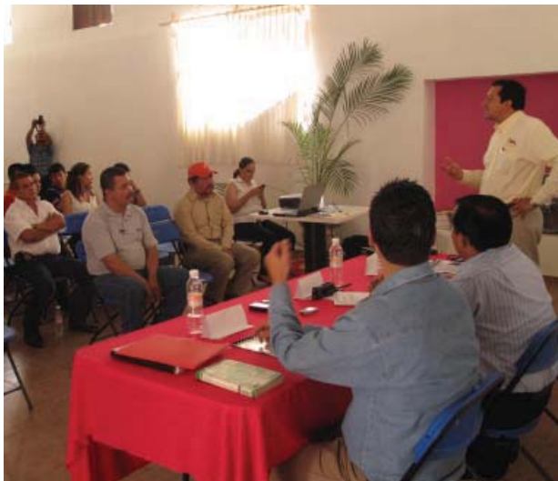
Impartición de pláticas con diversas instituciones políticas.