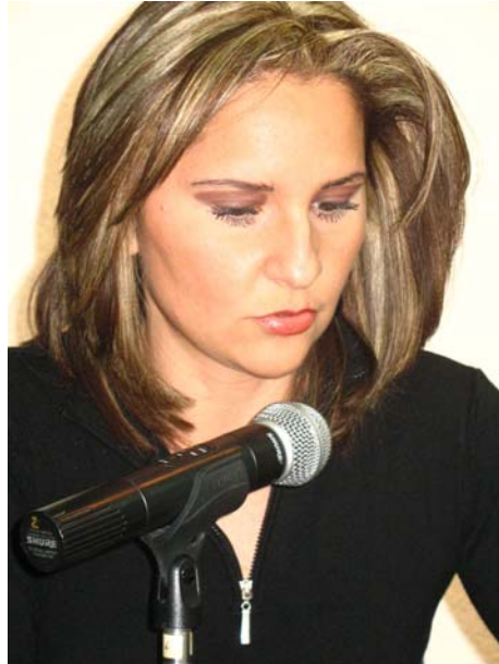
Lic. Cecilia Pérez Zepeda Presidenta del Consejo General

E l presente documento atiende lo dispuesto por el artículo 68, fracción XXIV, de la Ley Electoral del Estado, que impone la obligación del Instituto Electoral de Querétaro de rendir a la Legislatura del Estado y a la ciudadanía, dentro del primer trimestre del año, un informe que dé cuenta de las actividades más relevantes durante el ejercicio anual recién concluido. Estructurado en diez apartados, este documento ofrece una vista panorámica del cumplimiento de las responsabilidades constitucionales y legales confiadas a este organismo, durante 2007.