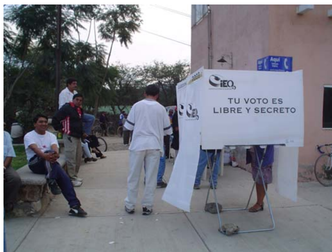
Apoyo en la elección de autoridades auxiliares.

E l 30 de septiembre de 2006, el Consejo General aprobó el Acuerdo que autorizó al Director General a suscribir convenios de colaboración con los ayuntamientos del estado que así lo requirieran, para coadyuvar en la preparación y organización de los procesos de elección de sus autoridades auxiliares. Los municipios solicitantes que suscribieron convenio fueron: Cadereyta de Montes, Corregidora, Pedro Escobedo, Pinal de Amoles, San Juan del Río, Querétaro y Tequisquiapan.