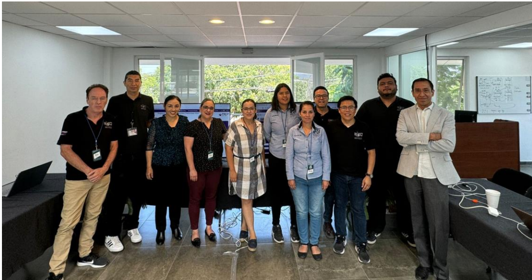
Integrantes del COTAPREP y la Dirección de Tecnologías de la Información en el cierre de operaciones del PREP.