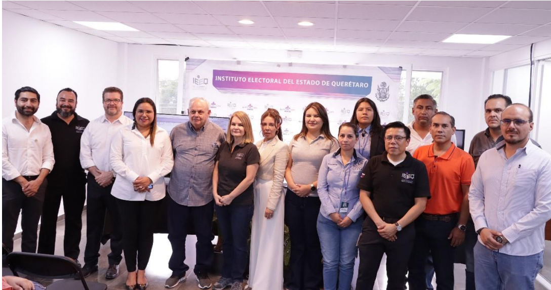
Integrantes del Consejo General, Ente Auditor y Dirección de Tecnologías de la Información, previo al inicio de operaciones del PREP.

Las actividades transcurrieron de manera ordenada, sin que se presentaran incidentes graves, por lo que no se generaron observaciones al respecto.