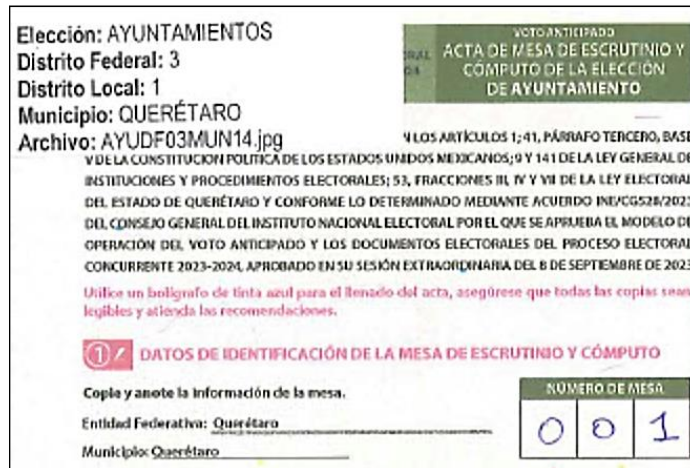
Imagen parcial de Acta de Mesa de Escrutinio y Cómputo de Voto Anticipado

Como una medida provisional para solventar esta circunstancia, se sostuvo una reunión con la Vocalía Ejecutiva de Organización Electoral de la Junta Local Ejecutiva del INE en Querétaro, y se hizo entrega de una base de datos y etiquetas para que fueran colocadas en las actas, previo a su digitalización y envío.