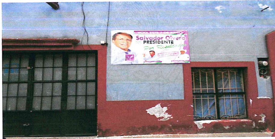
Calle Morelos número 71, entre calle 5 de Mayo y Javier Mina, colonia Centro, en San Juan del Río, Querétaro.