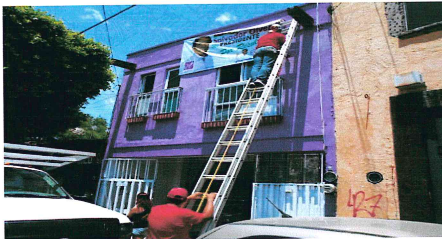
Calle 5 de Mayo número 5-C, colonia Centro, en San Juan del Río, Querétaro.