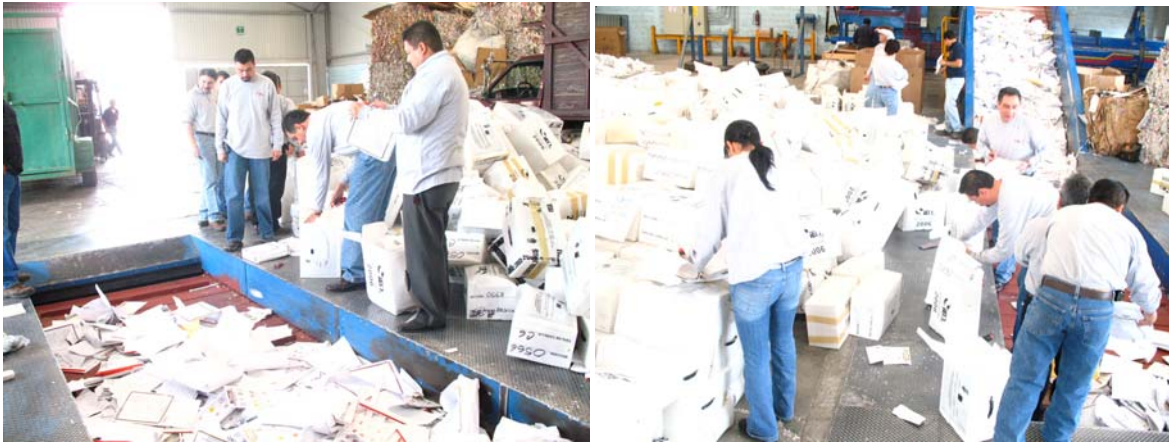
Destrucción de Documentación y Material Electoral.