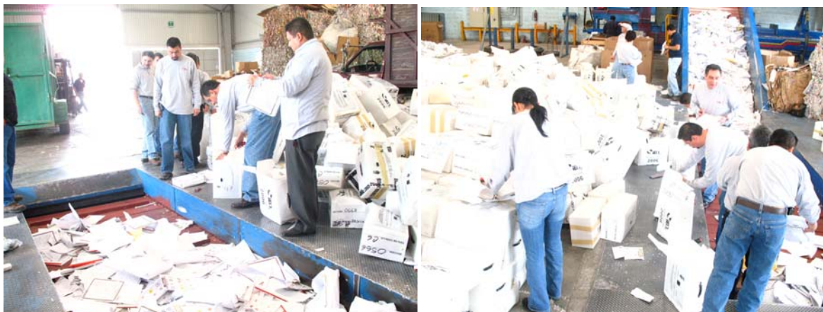
Destrucción de Documentación y Material Electoral.