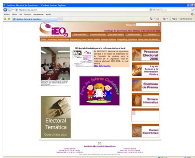
Página web del IEQ.