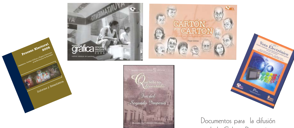
Documentos para la difusión de la Cultura Democrática