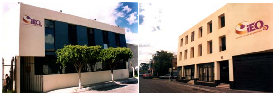
El Instituto Electoral de Querétaro.