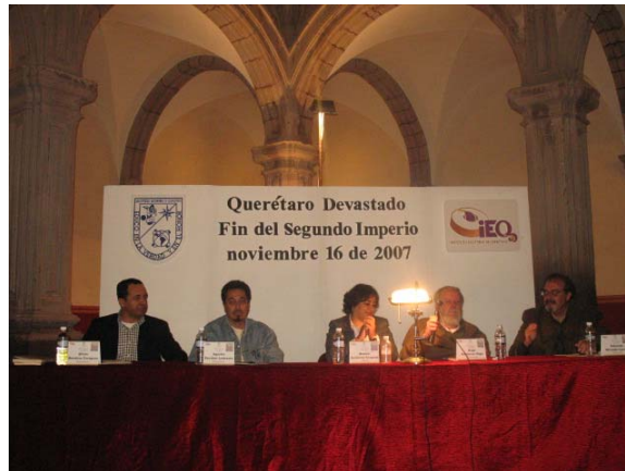
Presentación del libro Querétaro Devastado .