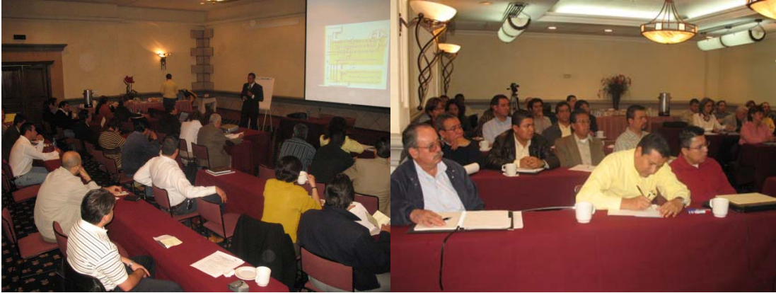
Curso de Derecho Electoral impartido por funcionarios del Centro de Capacitación Judicial Electoral del Tribunal Electoral del Poder Judicial de la Federación.