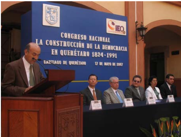
Congreso Nacional “La Construcción de la Democracia en Querétaro 1824-1991”.