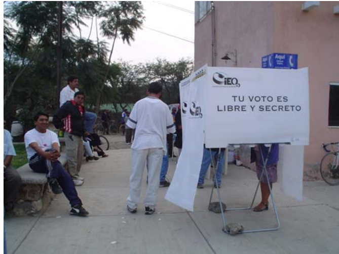
Apoyo en la elección de autoridades auxiliares.

E l 30 de septiembre de 2006, el Consejo General aprobó el Acuerdo que autorizó al Director General a suscribir convenios de colaboración con los ayuntamientos del estado que así lo requirieran, para coadyuvar en la preparación y organización de los procesos de elección de sus autoridades auxiliares. Los municipios solicitantes que suscribieron convenio fueron: Cadereyta de Montes, Corregidora, Pedro Escobedo, Pinal de Amoles, San Juan del Río, Querétaro y Tequisquiapan.