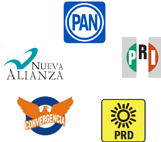
Fuerzas Políticas con registro ante el IEQ.

L os derechos y obligaciones de los partidos y asociaciones políticas se establecen en los artículos del 33 al 36 de la Ley Electoral del Estado de Querétaro.