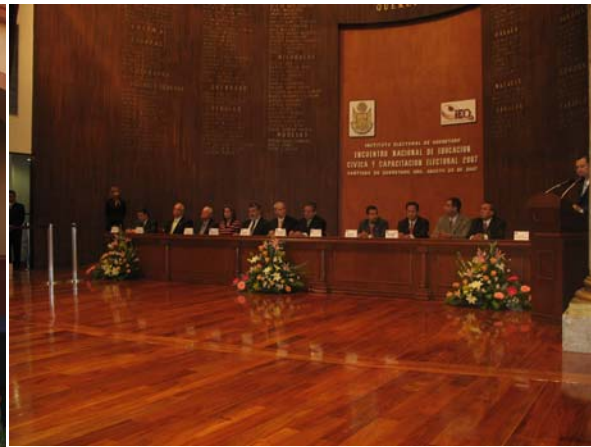
Encuentro Nacional de Educación Cívica y Capacitación Electoral 2007.