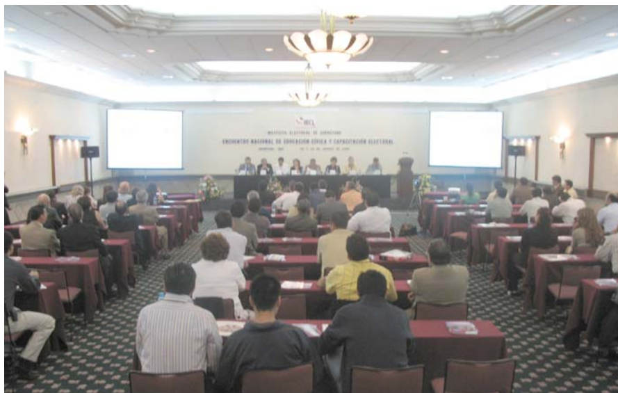
Encuentro Nacional de Educación Cívica y Capacitación Electoral, evento que tuvo repercusión en el ámbito nacional.

E l profesionalismo con el cual se desempeñan los funcionarios del IEQ, ha permitido el cumplimiento de diversos programas de actividades que el Consejo General aprueba año con año. Estas tareas tienen su fuente principal en lo estipulado por la Ley Electoral del Estado de Querétaro y el Reglamento Interior; de ahí se han desprendido acciones de carácter multidimensional encaminadas a explorar y consolidar el mandato constitucional dado al IEQ.