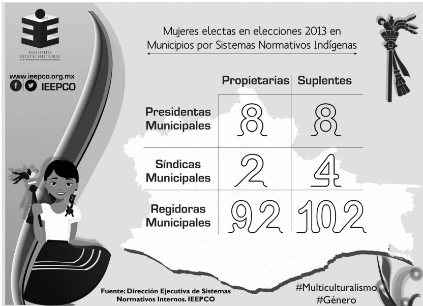
FIGURA 1. Resultados de mujeres electas en ayuntamientos de SNI

FUENTE: DIRECCIÓN EJECUTIVA DE SNI DEL IEPCO, resultados de mujeres electas en ayuntamientos de SNI en 2013, consulta 1 abr 2018, disponible en http://www.ieepco.org.mx/observatorio/sistemas-normativos-indigenas/resultados-elecciones-sistemas-normativos-indigenas-2013